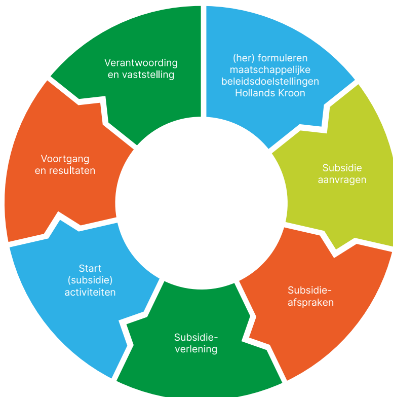
Figuur 1: de cyclus van subsidieverlening

Subsidieverlening is onderdeel van een cyclus die begint met het formuleren van beleidsdoelen. De activiteiten die de gemeente Hollands Kroon subsidieert, dragen bij aan deze maatschappelijke doelen. Op basis van de gemaakte afspraken kunnen organisaties starten met de uitvoering van de activiteiten. Tussentijds en na afloop geven de organisaties informatie over de voortgang en resultaten van de subsidieafspraken. Deze informatie wordt gebruikt om gemeentelijke beleidsdoelen en/of subsidieopdrachten opnieuw te formuleren of bij te stellen waar nodig