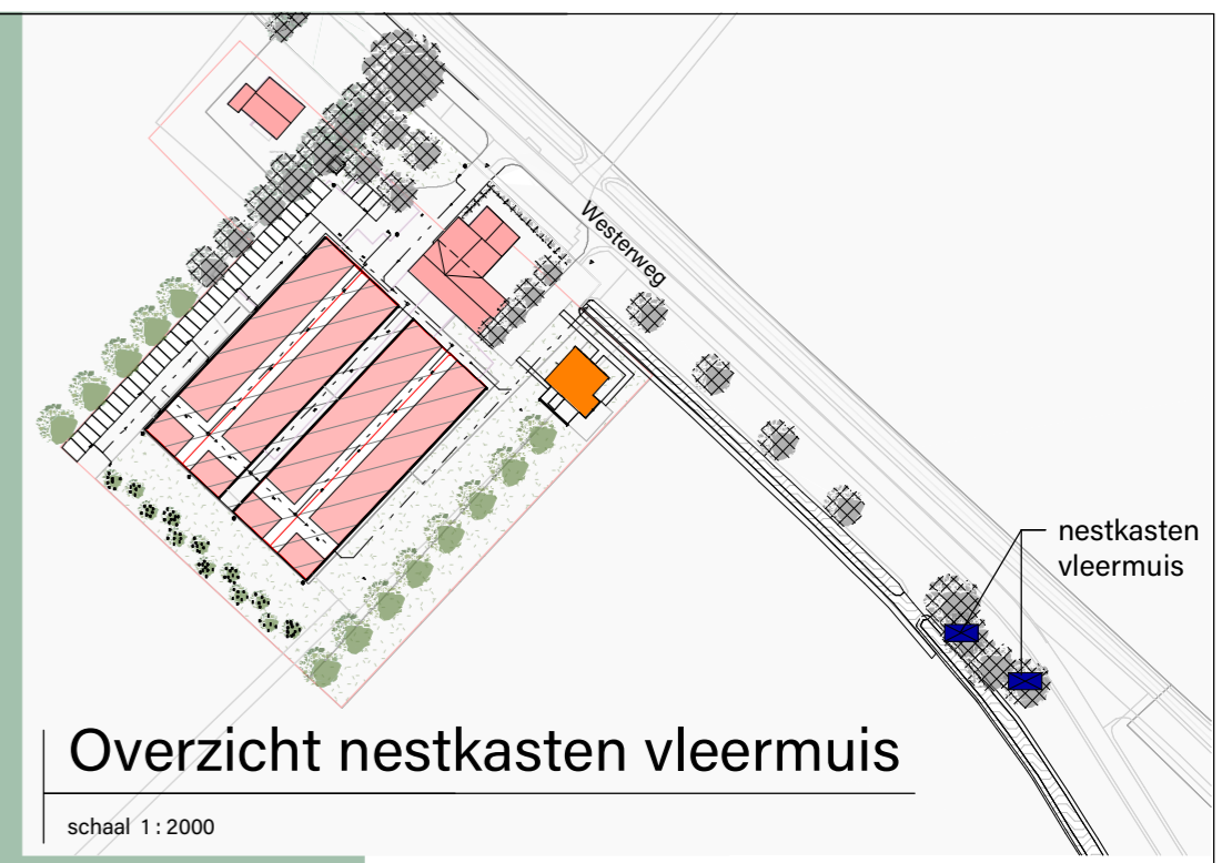
Overzicht nestkasten vleermuis